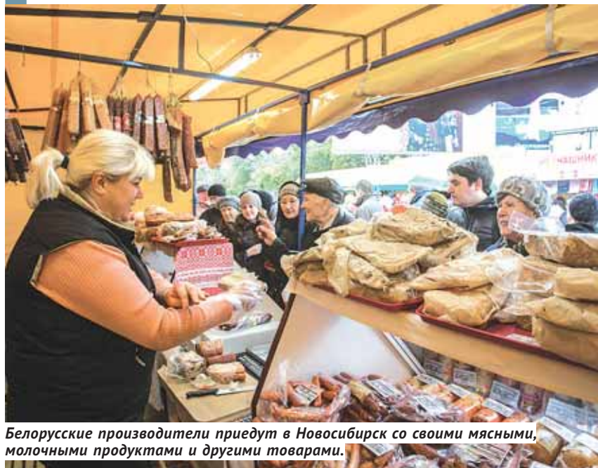
Белорусские производители приедут в Новосибирск со своими мясными, молочными продуктами и другими товарами.