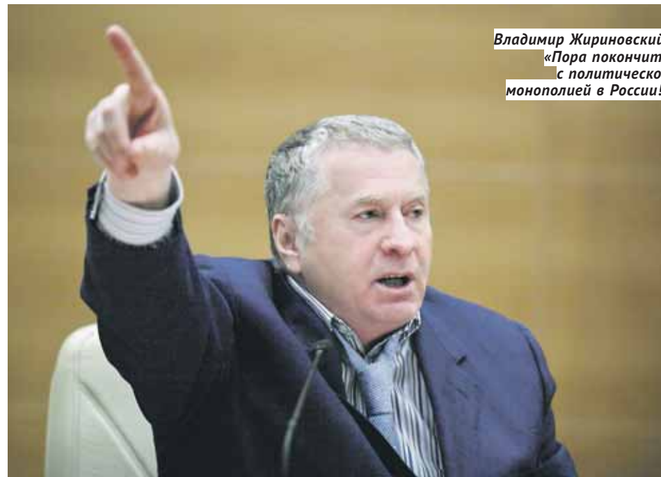
Владимир Жириновский: «Пора покончить с политической монополией в России!»

у разных людей — разные позиции. Не нравятся вам человек, не нравится его позиция — не общайтесь с ним, скажите, что не согласны, что у вас другая точка зрения, или озвучьте своё, другое предложение».