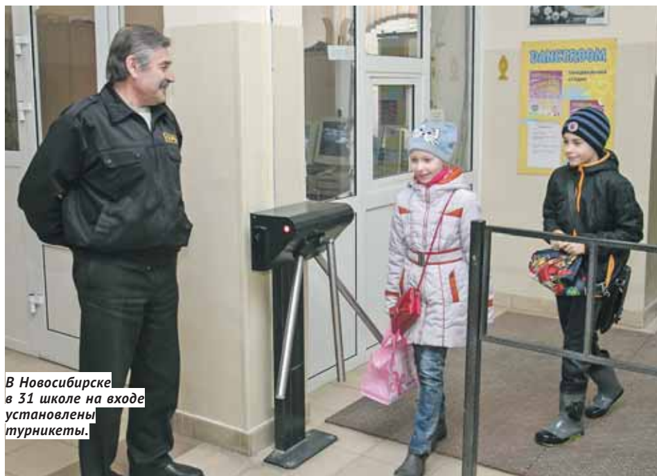
В Новосибирске в 31 школе на входе установлены турникеты.