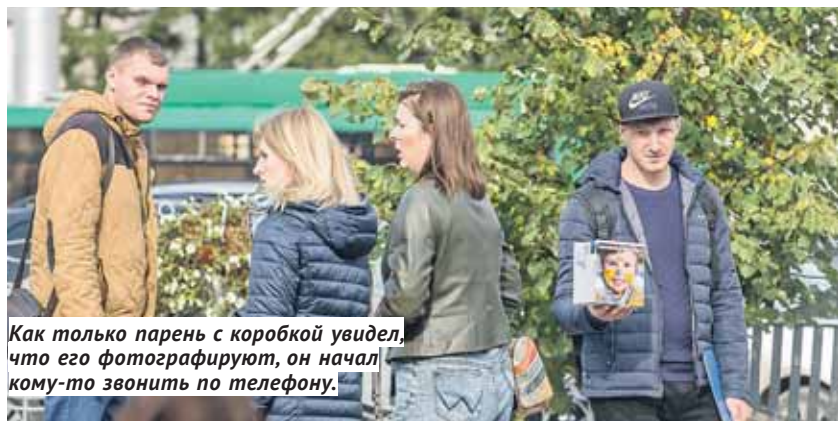
Как только парень с коробкой увидел, что его фотографируют, он начал кому-то звонить по телефону.

Это явление напоминает «прилив-отлив»: то накатит мутной пеной, то уберётся восвосяси, недовольно ворча. Сейчас вновь накатило — на центральных улицах и в Первомайском сквере появились тёмные личности с прозрачными коробками, которые собирают деньги «на детей» от имени Русфонда.