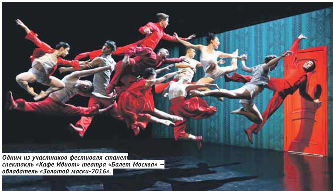
Одним из участников фестиваля станет спектакль «Кафе Идиот» театра «Балет Москва» — обладатель «Золотой маски-2016».

Восьмичасовой «Тихий Дон», мастер-класс военного оркестра и концерты в цирке — Рождественскому фестивалю искусств будет чем удивлять зрителей.