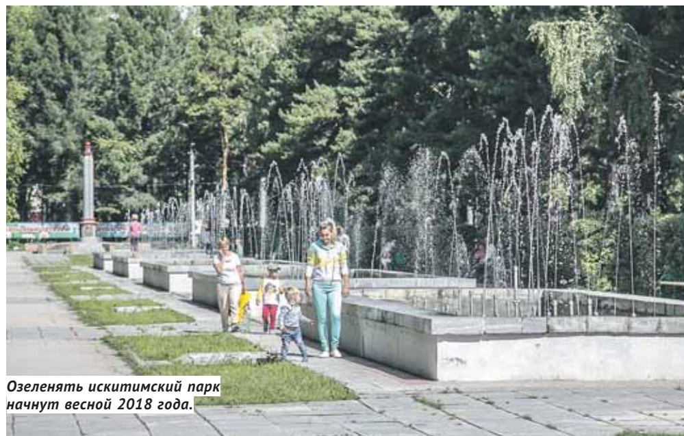
Озеленяют искитимский парк начнут весной 2018 года.

Глава Искитима Сергей Завражин добавил: искитимский парк — один из двух в области, вошедших в программу «Парки малых городов», на его обустройство выделено около 20 млн рублей. Там будут зоны тихого отдыха, аттракционов, спортивные, семейные — они, по словам главы города, обновляются капитально: строятся велодорожки, реконструируется освещение.