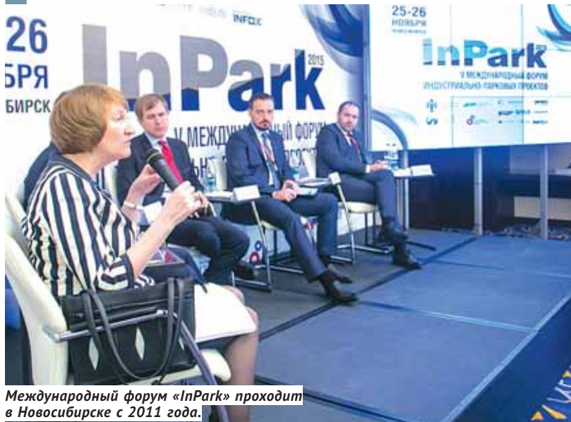
Международный форум «InPark» проходит в Новосибирске с 2011 года.